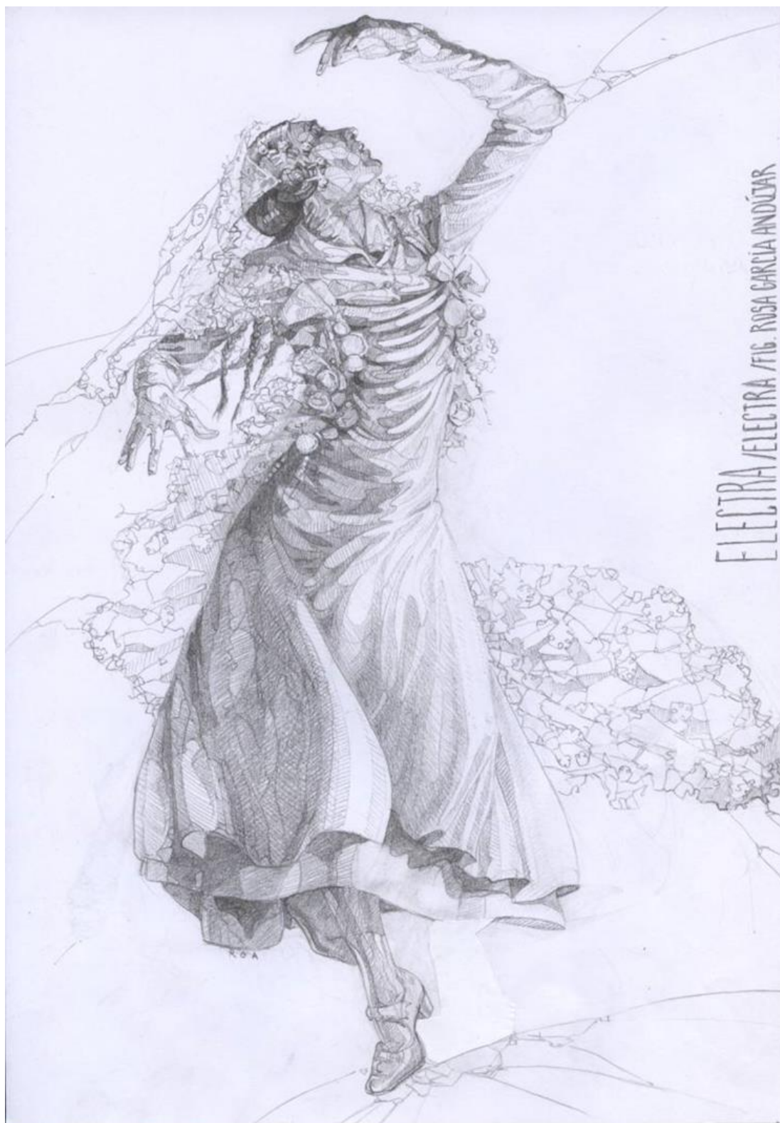
© Figurín de Electra por Rosa García Andujar, diseñadora del vestuario de Electra .